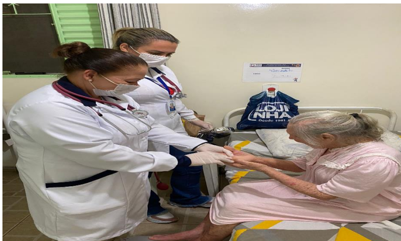
ATIVIDADES REALIZADAS PELO PROJETO PEROLAS DO TEMPO