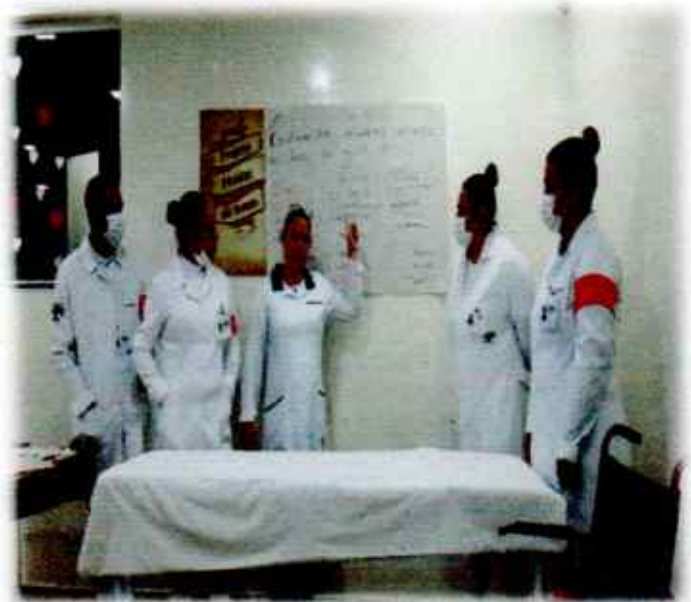
FIGURA 02 – CAPACITAÇÃO FUNCIONÁRIOS CUIDADOS COM OS IDOSOS ACAMADOS DURANTE O BANHO.