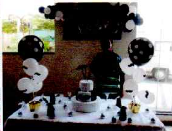
Comemoração do dia do Idoso 01/10/2020 Comemoração de Aniversário 02/10/2020.