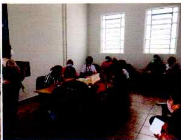
Reunião CMDPI 14/10/2020