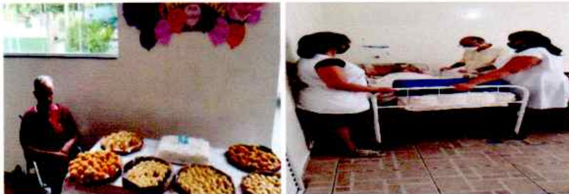
Comemoração de Aniversário 23/10/2020 Avaliação da enfermagem 29/10/2020