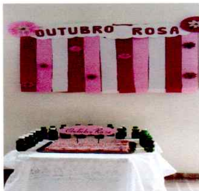
Outubro Rosa 30/10/2020