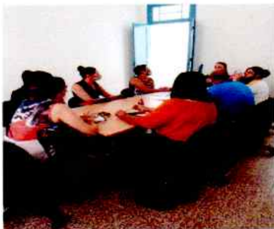
Reunião CMDPI 07/10/2020