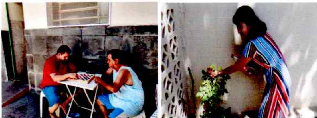
Tarde de Jogos 10/10/2020