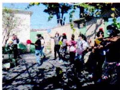
Figura 3: Palhaço da alegria, realizada em 21/06/2020.