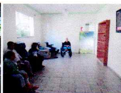
Figura 4: Sessão de cinema, realizada em 10/06/2020