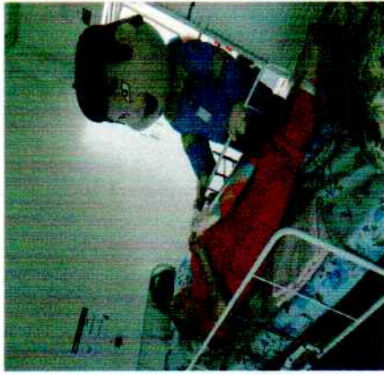
13/01/2020-Revitalização do Lar