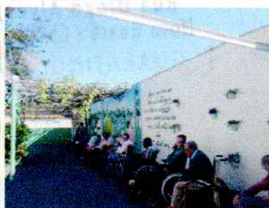
Figura 2: Banho de sol, realizada em 20/06/2020.