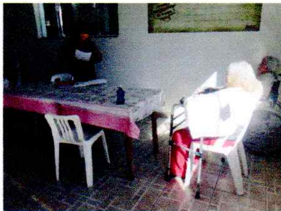
Reunião com idosos, realizada dia 16/06/2020.

Observações: utilize esse campo para informações que julgar necessário e não se encaixam nos itens anteriores.