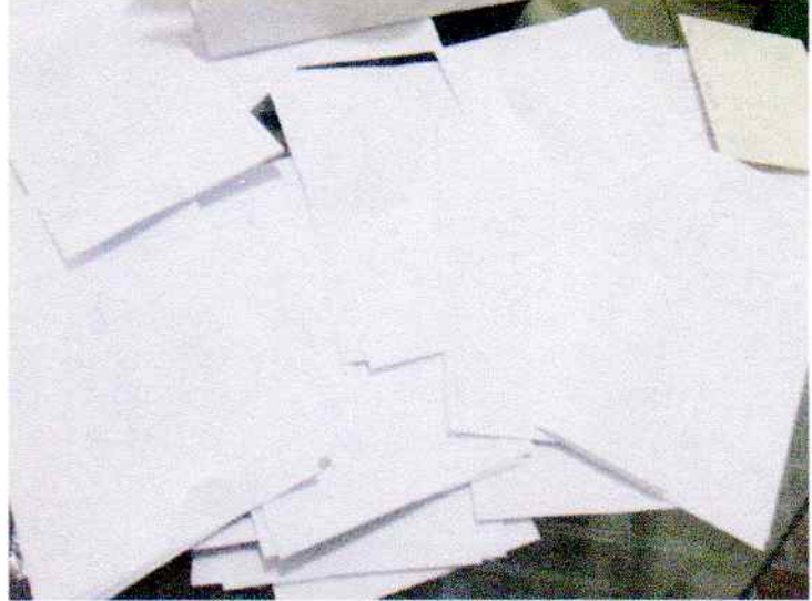
Figura 2: Doações da campanha "Cartinha Solidária". 08/06/2020

OBJETIVO ESPECÍFICO: Qualificar a oferta do serviço por meio da promoção de capacitação sistemática dos profissionais responsáveis pela oferta dos serviços.