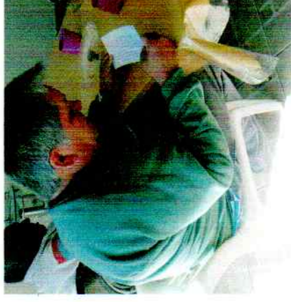
01/06/2020- Campanha Cartinha solidária.

RECEBEMOS 21/06/2020 Prefeitura M. de Guaratá.