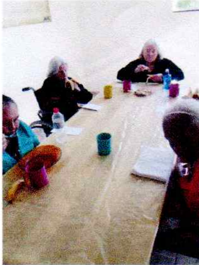
Figura 1: Leitura das cartas. 12/06/2020