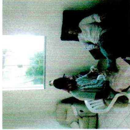
19/05/2020- Dia de cuidado com os pés