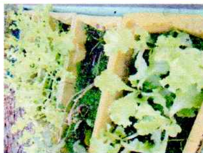
Figura 1: Horta elevada, realizada diariamente.

Observações: Algumas atividades foram suspensas devido ao coronavirus.