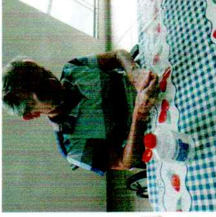
08/04/2020- Desinfetando as mãos